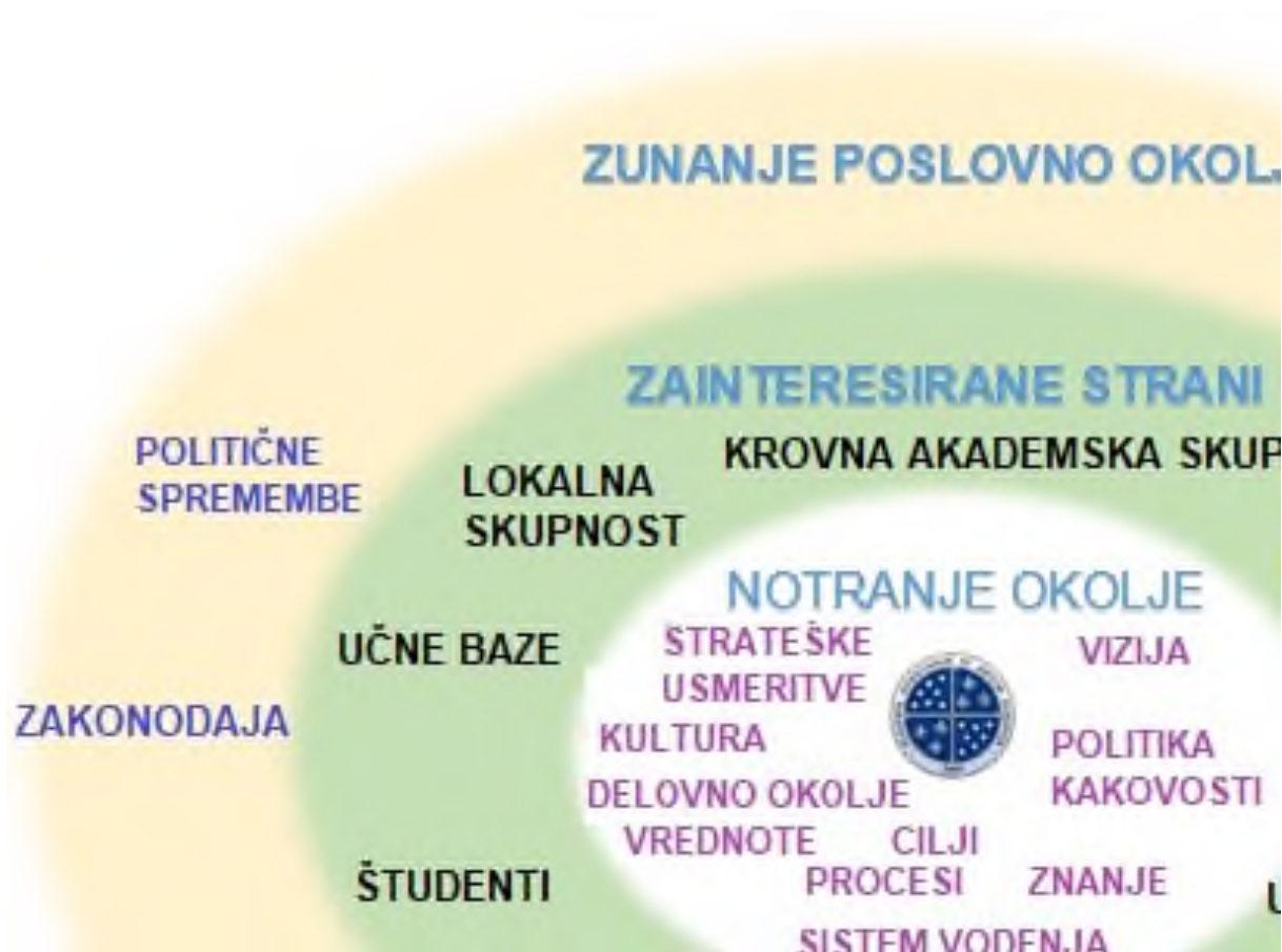
Slika 4.1: Razumevanje Alma Mater in njenega konteksta

Kot pomoč za prepoznavanje zunanjih in notranjih vprašanj, ki so pomembna za namen delovanja Alma Mater in njeno strateško usmeritev uporabljamo SWOT analizo. Pri tem analiziramo priložnosti in nevarnosti, ki izhajajo iz zunanjih politično-pravnih, ekonomskih, sociokulturnih in tehnoloških dejavnikov (PEST), ter prednosti in slabosti, ki izhajajo iz notranjega okolja Alma Mater na katero imamo vpliv.