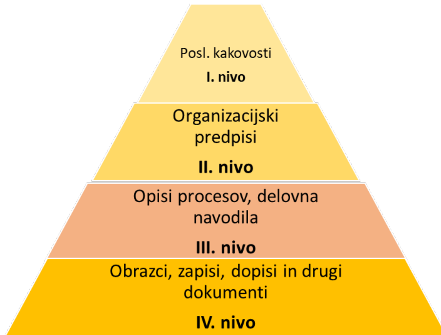
Slika 7.1: Nivoji dokumentiranih informacij

Posamezen nivo dokumentiranih informacij zajema naslednje: