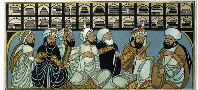
True and False Scholars Ulama-e-Haq and Ulama-e-Soo